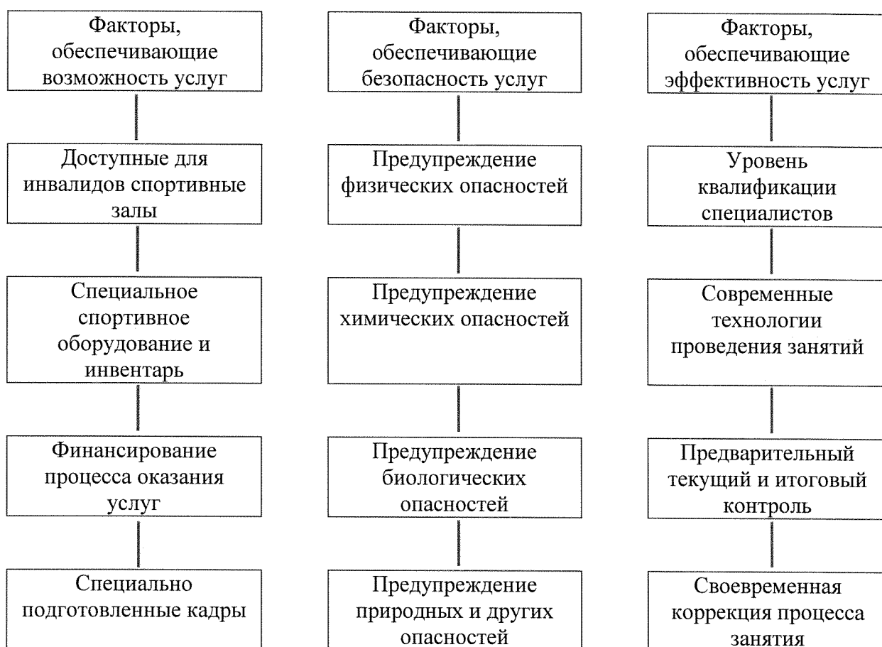
Рисунок 1. Факторы, влияющие на доступность услуг для инвалидов и других маломобильных групп населения на объектах спорта и в учреждениях и организациях, предоставляющих услуги

Понятно, что для обеспечения возможности предоставления и получения услуг для инвалидов и МГН необходимо наличие кадров, имеющих право работать с данным контингентом.